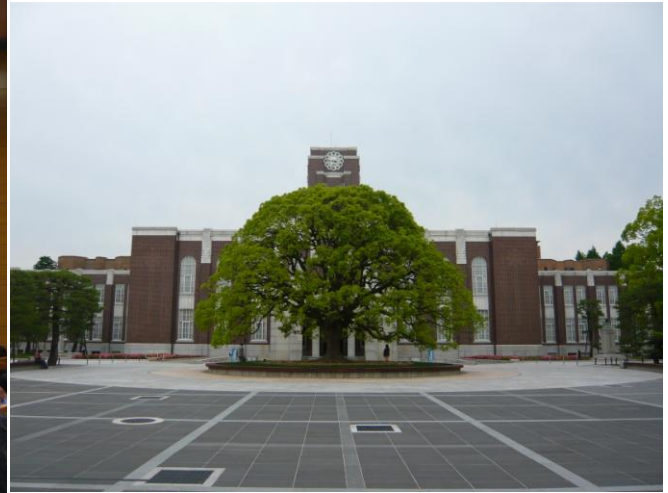
會議場地：The Clock Tower